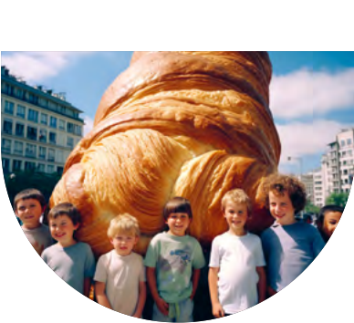
© Bérangère Jannelle, photo par A.

Enfants et parents, plongez dans l'histoire de la Révolution française à travers un dispositif original : une table, du pain, des briques et une pincée d'humour. Deux comédiens incarnent tous les personnages de cette période historique, et vous vous retrouvez au beau milieu des échanges animés sur les grands principes qui ont forgé la République. Une jolie façon de réfléchir au rôle de la citoyenneté et du débat public.