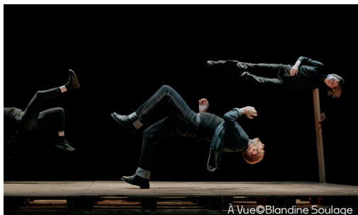
À Vue

vendredi 20 mars. 20h. Tarif spécial : 5€