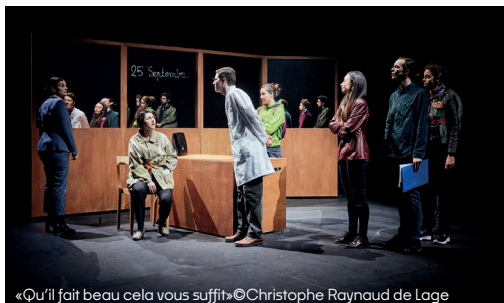
«Qu'il fait beau cela vous suffit»