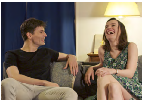
Tinder Surprise de Rodolphe Bouquet

Plus d'infos : 02 54 74 33 22 – http://blois-les-lobis.cap-cine.fr/